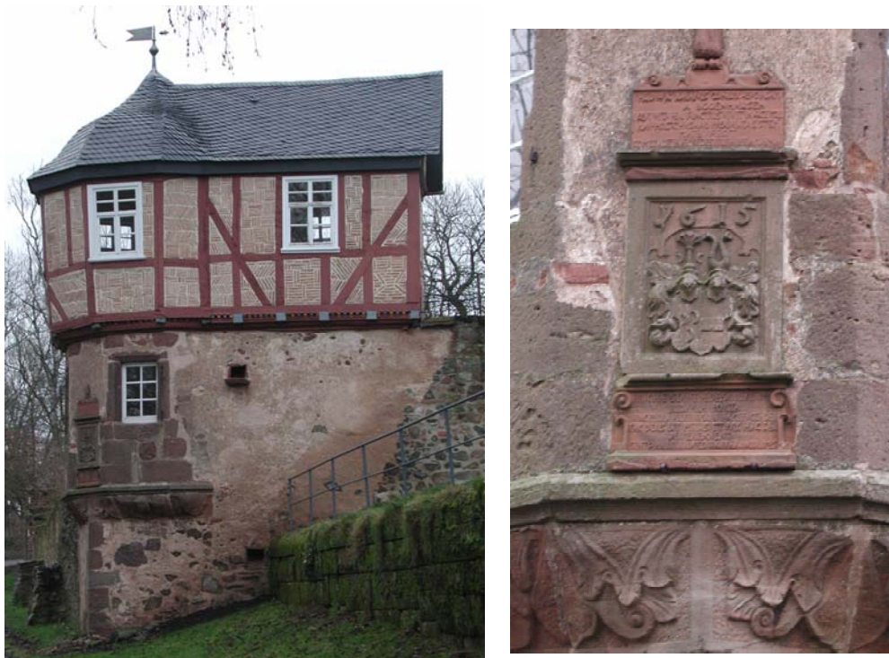
Abb. 4 Das Amönauer „Lusthäuschen“ von 1615 mit Gedenkstein.

Vielleicht geht die Planung des berühmten, 1615 errichteten Amönauer Lusthäuschens sogar noch auf Hans von Bodenhausen zurück, der immer wieder betonte, sein Leben in Zurückgezogenheit verbringen zu wollen. Dies war ihm nicht vergönnt, sondern er hat sich im Dienst des Landgrafen aufgegeben. Ob dieser ihm, wie er und sein Vater Wilhelm IV. es in anderen Fällen auch getan haben, 74 ein kostbares Musikinstrument geschenkt oder er es käuflich erworben hat, lässt sich nicht mehr entscheiden.